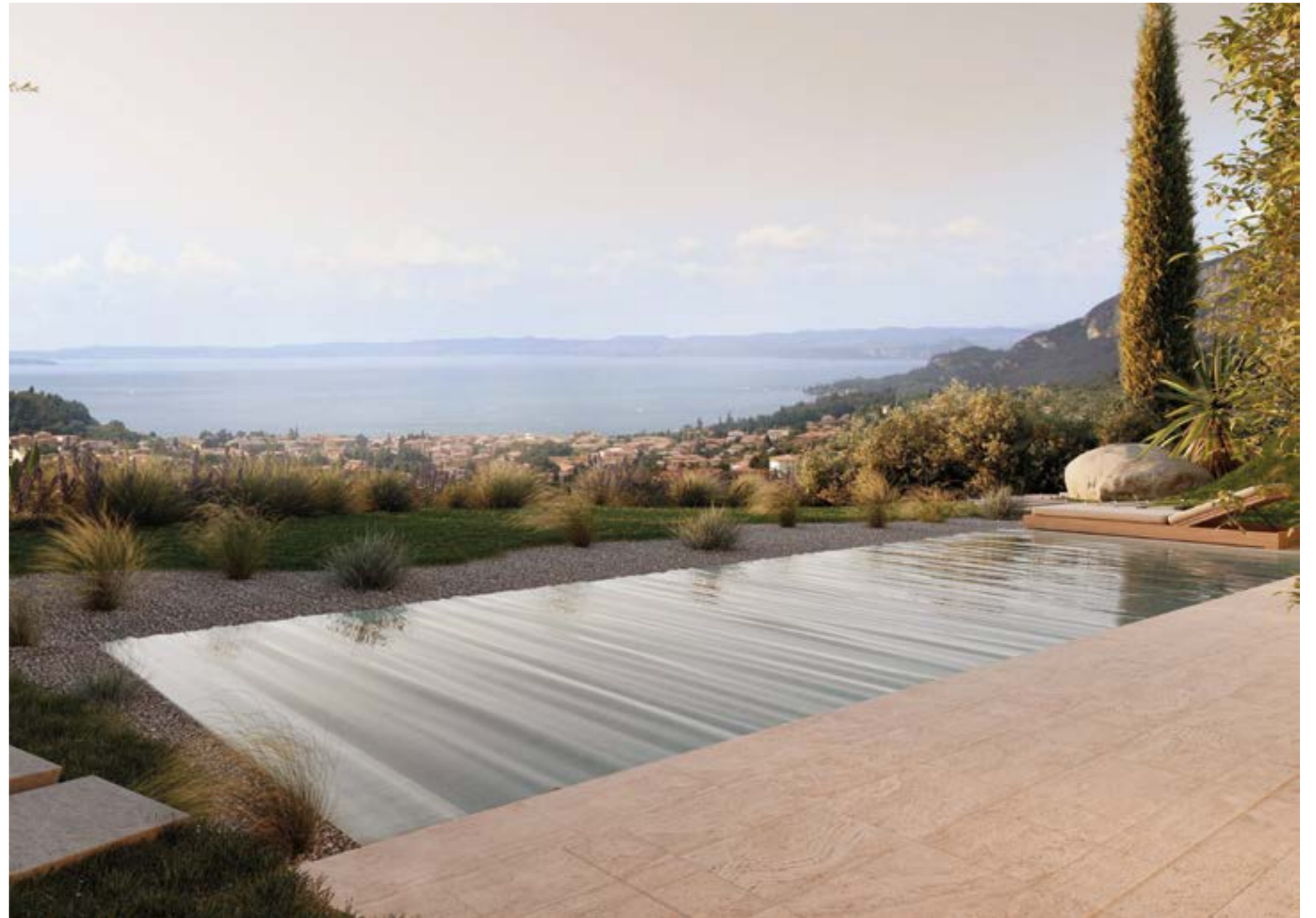
▲ Piscina con vista panoramica